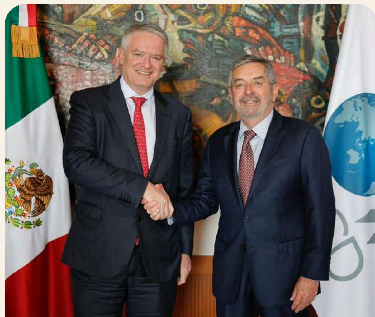
El Secretario General y el ex Secretario de Relaciones Exteriores.