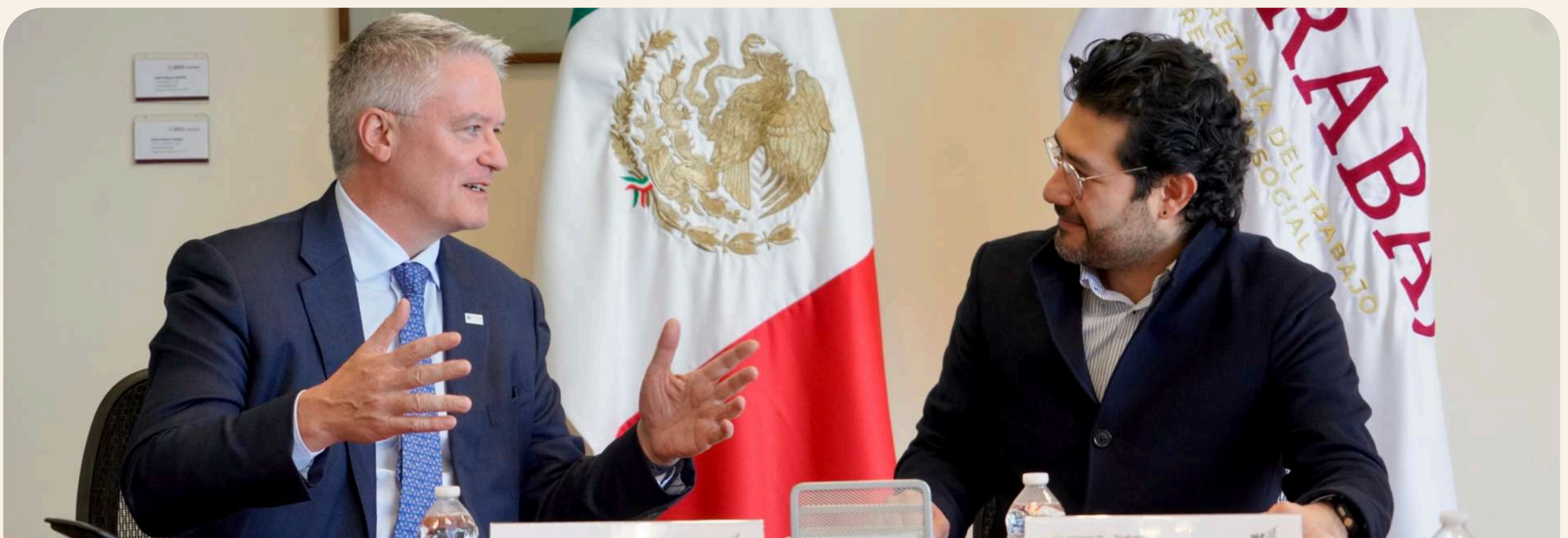
El Secretario General, Mathias Cormann y el Secretario de Trabajo y Previsión Social, Marath Bolaños.