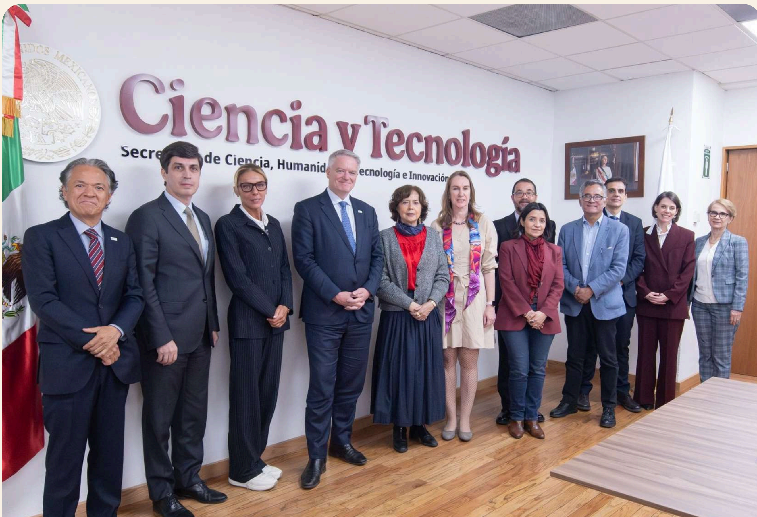
En la reunión OCDE-SECIHTI.

El Secretario General de la OCDE, Mathias Cormann, sostuvo una reunión de trabajo con la secretaria de Ciencia, Humanidades, Tecnología e Innovación, Rosaura Ruiz Gutiérrez, el viernes 27 de febrero de 2026. Durante el encuentro, Rosaura Ruiz destacó la prioridad que el Gobierno de México otorga al fortalecimiento de las políticas públicas en materia de ciencia, humanidades, tecnología e innovación, y presentó la creación de la SECIHTI como una muestra de ese énfasis institucional. Señaló además que la dependencia busca articular capacidades, conocimiento y talento para consolidar un sistema nacional en estos ámbitos y fortalecer la colaboración entre los sectores académico, gubernamental, privado y social. Por su parte, Cormann reconoció los avances de México en materia de ciencia y tecnología y vinculó esa agenda con los hallazgos del Estudio Económico de México 2026 y del estudio de la OCDE sobre semiconductores, en particular en lo relativo al fortalecimiento del talento especializado, la transferencia tecnológica y la articulación entre investigación e industria. Al cierre, el Secretario General invitó a la Secretaria a participar en los trabajos del Comité de Ciencia, Tecnología e Innovación de la OCDE, mientras que Rosaura Ruiz reiteró el interés del Gobierno de México en profundizar la cooperación con la Organización en innovación, desarrollo científico y formación de talento. 🌐