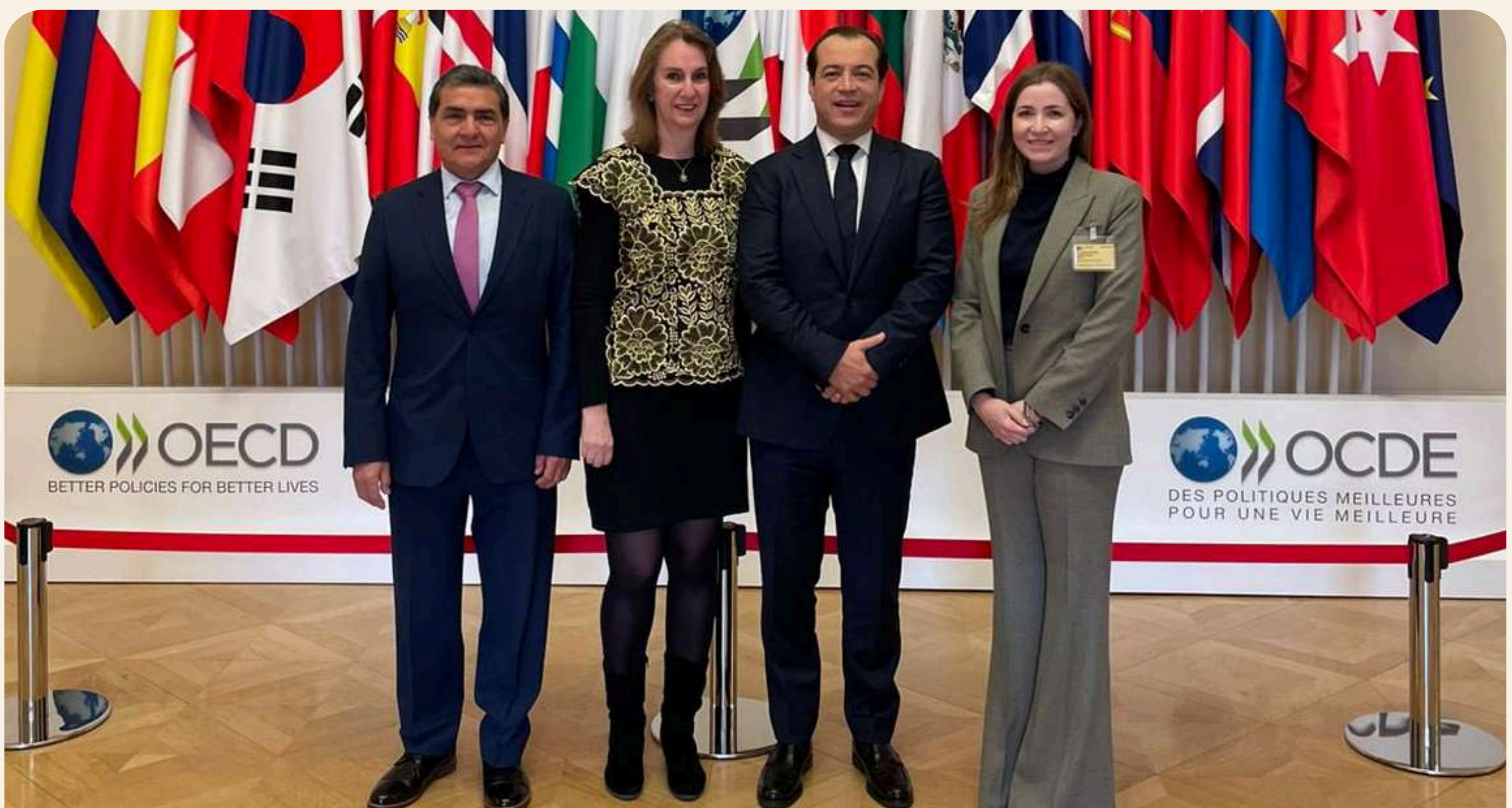
Delegación mexicana en el salón de banderas