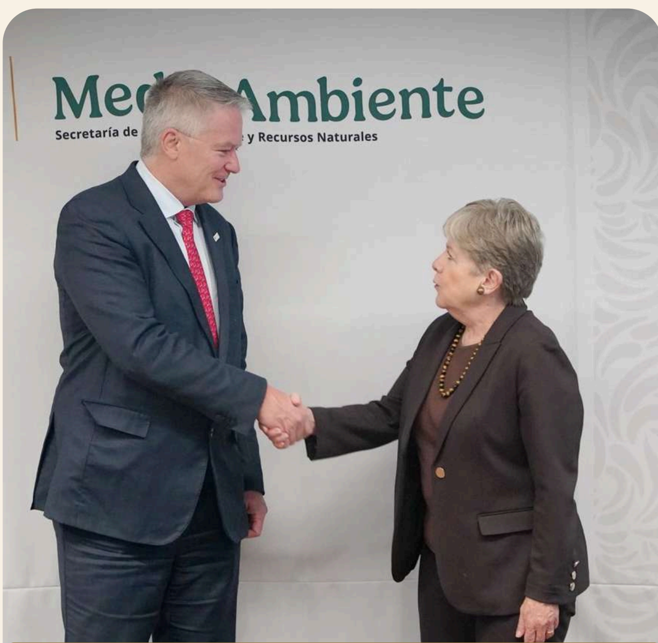
El Secretario General y la Secretaria de Medio Ambiente y Recursos Naturales

También dialogaron sobre la relevancia estratégica del desarrollo del ecosistema de semiconductores en México y sobre la conveniencia de articular esfuerzos entre distintas dependencias para aprovechar el proceso de relocalización de cadenas productivas. Asimismo, abordaron el contexto que enfrenta actualmente la OCDE en su relación con Estados Unidos, la importancia de preservar espacios eficaces de cooperación multilateral y los preparativos rumbo a la Reunión del Consejo a Nivel Ministerial de 2026. 🌐