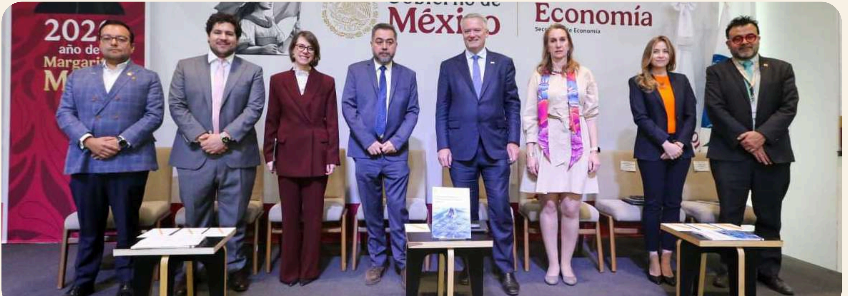
Presentación del estudio

El Secretario General de la OCDE, Mathias Cormann, presentó el estudio Promoción del Desarrollo del Ecosistema de Semiconductores en México 2026 el viernes 27 de febrero en el vestíbulo de la Torre Ejecutiva de la Secretaría de Economía.