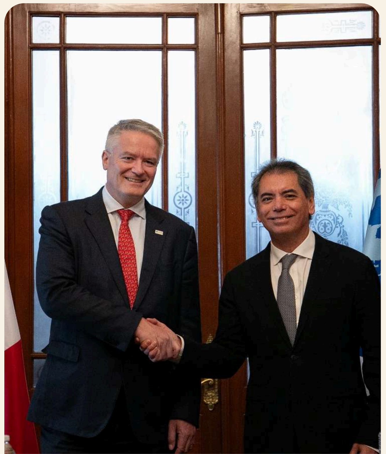
El Secretario General y el Secretario de Hacienda y Crédito Público.

El Secretario General de la OCDE, Mathias Cormann, sostuvo una reunión bilateral con el secretario de Hacienda y Crédito Público, Edgar Abraham Amador Zamora, el jueves 26 de febrero, previo a la presentación del Estudio Económico de México 2026. Durante el encuentro, Cormann y Amador intercambiaron puntos de vista sobre las perspectivas económicas de México en el contexto internacional, con particular atención a los hallazgos preliminares del Estudio Económico de México 2026.