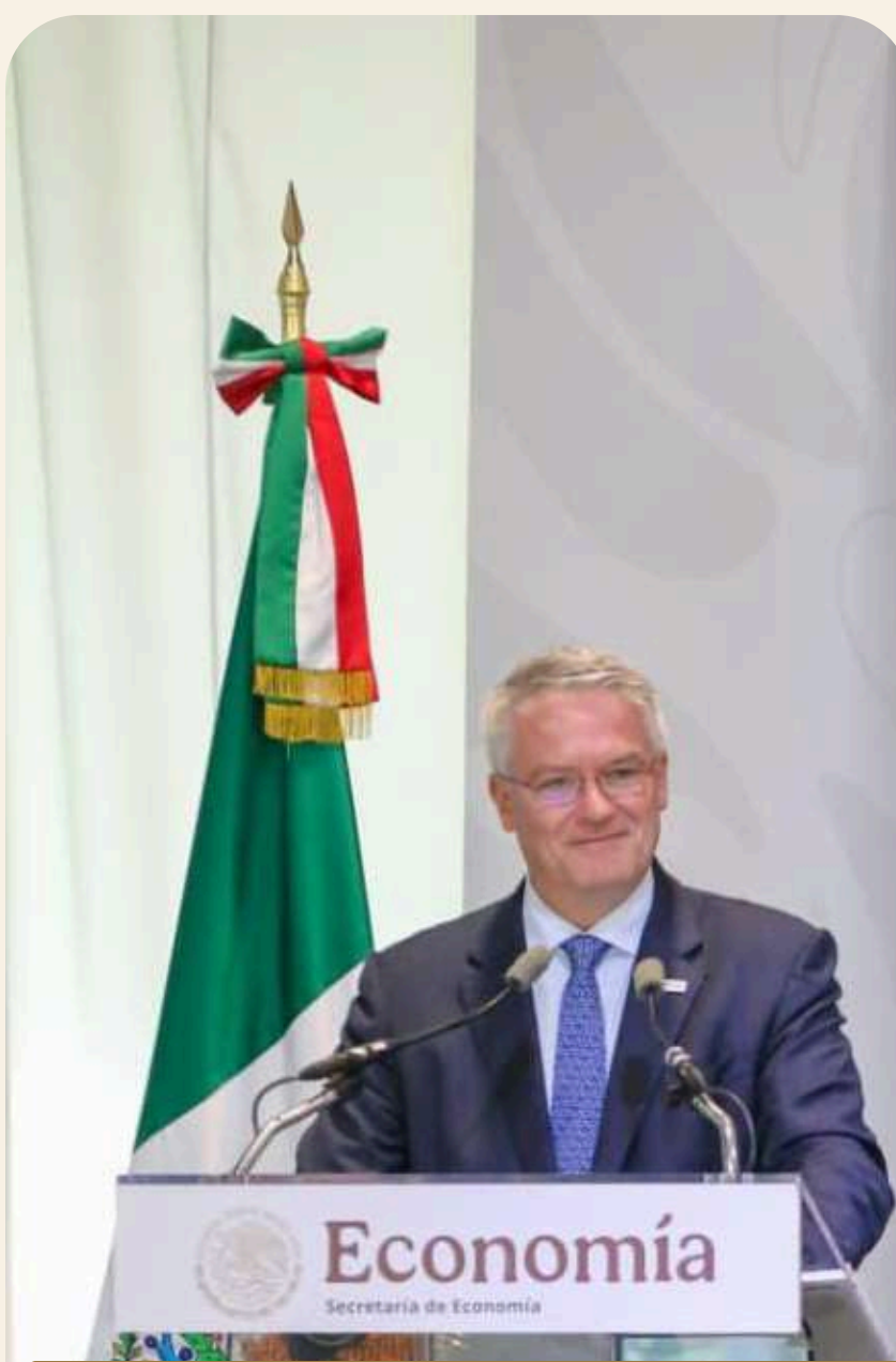
El Secretario General durante la presentación